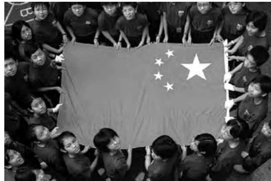
Hong Kong, 1997.

Promjene u društvu većinom su uvjetovane razvojem unutarnjih proturječja u društvu, to jest, proturječja između proizvodnih snaga i odnosa u proizvodnji, proturječja između klasa te proturječja između staroga i novoga; upravo je razvoj tih proturječja ono što potiče napredak društva i daje poticaj za mijenjanje staroga društva novim. — “O proturječju” (kolovoz 1937)