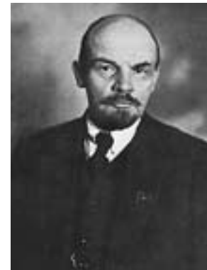
Vladimir Iljič Lenjin

To još valja prodiskutirati. Marx je držao da u socijalizmu, kao prvoj fazi revolucionarne promjene, “uski buržoaski horizont prava”, naime buržoasko zakonodavstvo, još nije prevaziđeno. Lenjin je to prokomentirao: “s (poluburžoaskim) pravom, ni (poluburžoaska) država nije potpuno nestala” ( Marxism on the State , Moscow 1972., str. 32.). U najboljem bih slučaju nazvao SFRJ polusocijalističkom državom, ali taj je napredak bio nečuveni za Balkan.