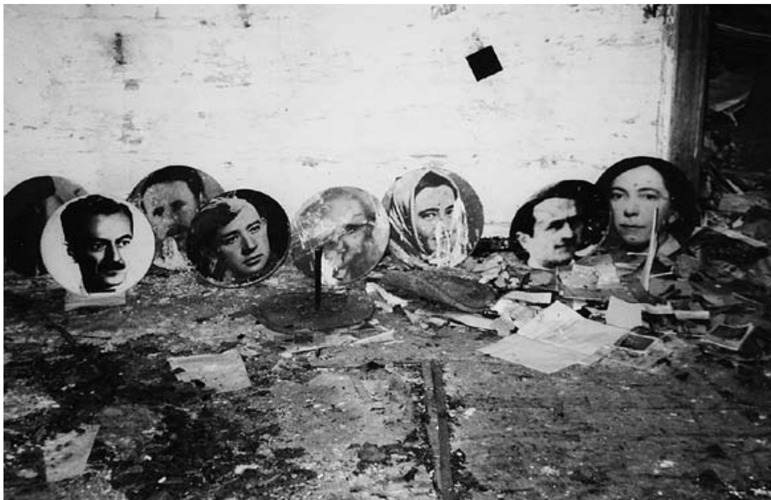
Uništena spomen kuća, Petrova gora

Što je, po meni, nedostajalo u SFRJ-u? Mnogo toga, ali prije svega uvid da povijest ne prestaje i da je, ustvari, u uvjetima ubrzavanja moderne tehnologije i ideologije nužna permanentna kulturna revolucija, permanentna kritika i samokritika kao preispitivanje i preinaka, a ne napuštanje komunističkih horizonata. To bi, među ostalim, bilo dovelo do mogućnosti političkog kolektiva koji bi mogao kako prihvatiti autonomne komunističke intelektualce u okvir zajedničke Stvari tako i razmatrati daljnje oslobođenje rada (ta su dva problema povezana). Tada bismo se doista mogli vratiti Brechtovoj "Pohvali partije" ("Lob der Partei"): "Mi smo ona".