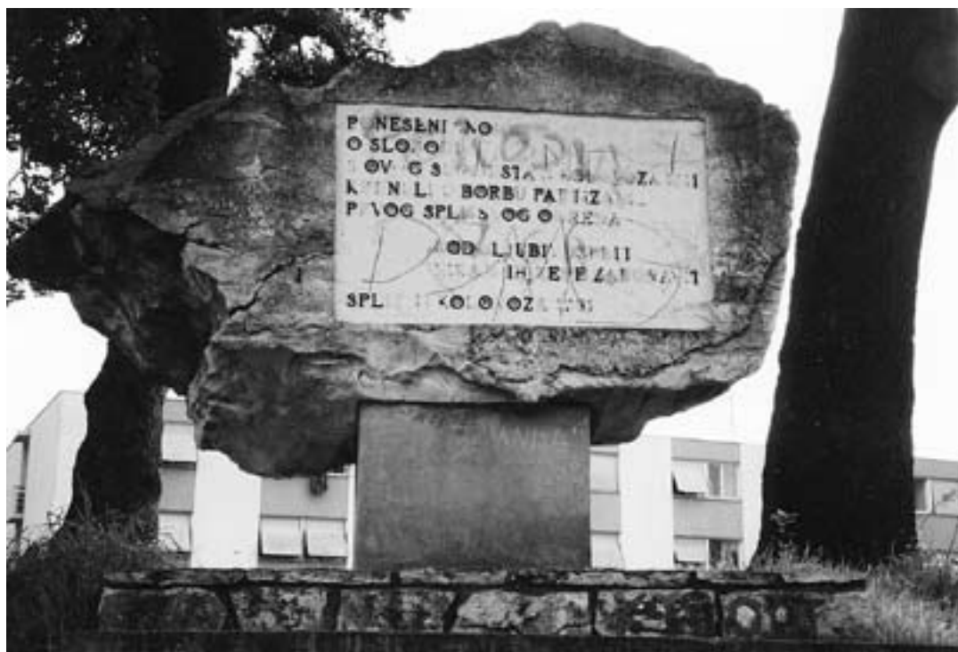
Uništena spomen ploča, Split