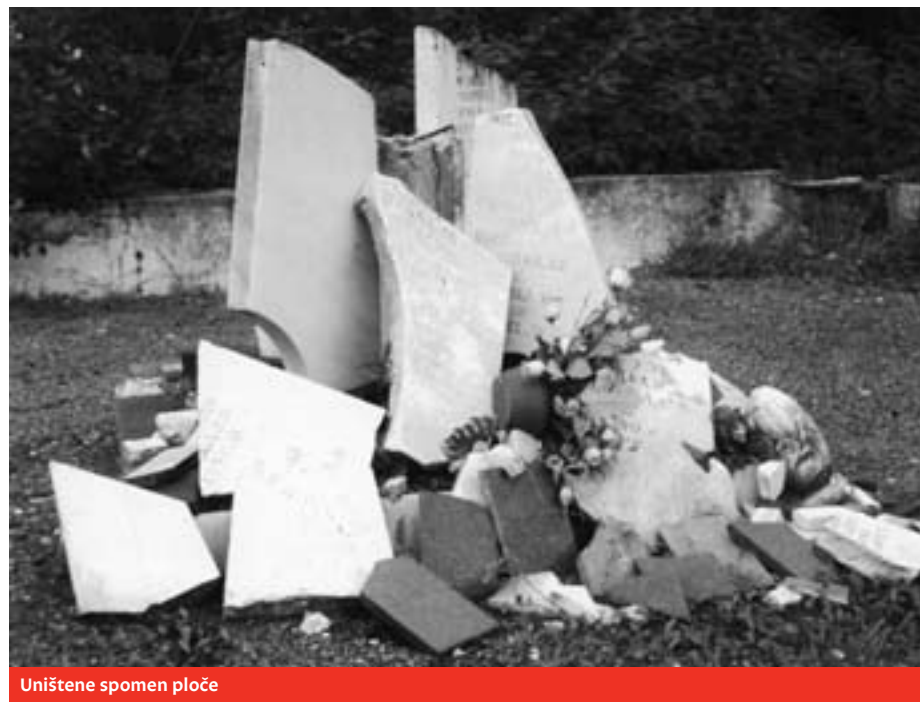
Uništene spomen ploče

S ruskoga preveo Ivo Alebić dio knjige Komunizam kao religija koja izlazi kod Frakture u 2010.