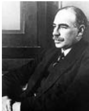
John Maynard Keynes

Trenutačna kriza stoga nije niti financijska kriza niti suma većega broja sistemskih kriza, nego kriza imperijalističkog kapitalizma “oligopola”, čija je ekskluzivna i superiorna moć u opasnosti da opet bude dovedena u pitanje borbama narodnih klasa i nacija dominirane periferije, čak i onih za koje se danas čini da predstavljaju prvenstveno “tržišta u usponu”. Kriza je uje-