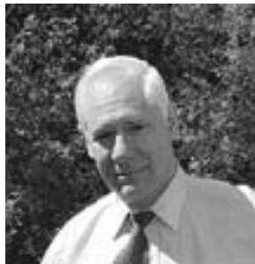
André Gunder Frank

Analiza koju smo razvili vezano uz veliku novu krizu, za koju smo tada vjerovali da je započela, dovela