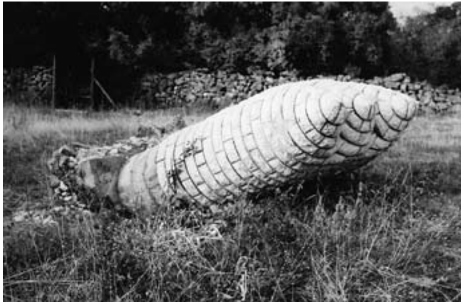
Oštećen spomenik žrtvama NOB-e, Očestovo

legitimiteta politike na vlasti. I ova novija poslijeratna politika nastoji ostati sankrosanktna i sačuvati nekadašnji oblik legitimiteta usprkos i ponad “racionalno-pravnog legitimiteta” (M. Weber) slobodnih višepartijskih izbora. Kako nas neprestano uvjeravaju političari na vlasti, svejedno o kojem lokalnom političkom režimu da govorimo, upravo poginuli borci i civilne žrtve posljednjeg rata ne bi dozvolili da se vladajuća politika radikalno pacifizira i da izgubi svoju etno-nacionalnu bit. Treba razmotriti politički utjecaj unija veterana i manipulacije političara na vlasti njihovim interesima u post-konfliktnim zonama bivše Jugoslavije da bi se otkrili drevni predpolitički mehanizmi legitimacije režima.