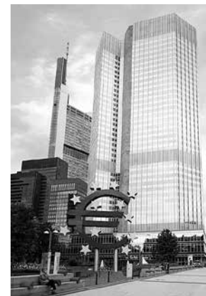
European Central Bank

2) EU se ne može reformirati bez pravog novog utemeljenja. Ali i sam je taj pojam dvosmislen. Ono što je bjelodano zastarjelo čuvena je “metoda Monnet”, koju se često prikazuje u smislu pravog lukavstva povijesti :